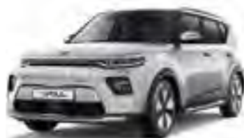
Sparkling Silver (KCS)