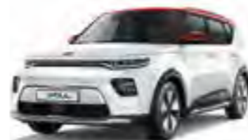
Clear White + Inferno Red (AH1)