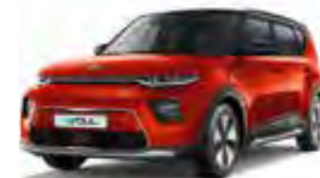
Mars Orange + Cherry Black (SE3)

De getoonde afbeeldingen zijn voorzien van het beschikbare SUV Pack.