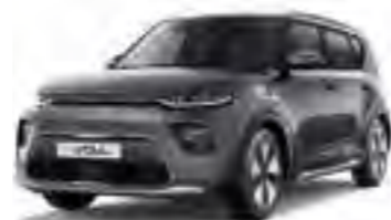
Gravity Grey (KDG)