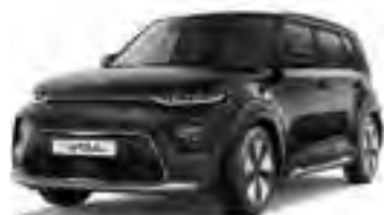
Cherry Black (9H)