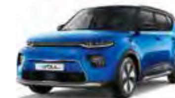
Neptune Blue + Cherry Black (SE2)