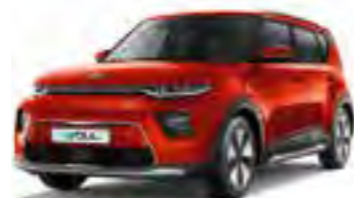
Mars Orange (M3R)