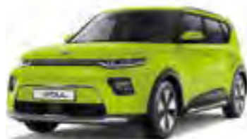
Space Cadet Green (CEJ) Solid

De nieuwe Kia e-Soul is een uiting van vrolijkheid, van harmonie tussen natuur en hightech. Om dat te vieren is hij leverbaar in een unieke selectie van tinten: 8 stijlvolle one-tone uitvoeringen en 5 prachtige two-tone combinaties. Heldere tinten en metallic lakken van de hoogste kwaliteit. Daarvan geniet je keer op keer, vele jaren lang.