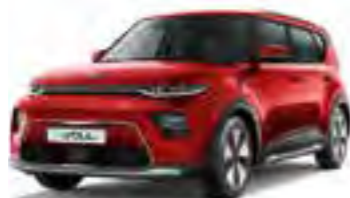
Inferno Red (AJR)