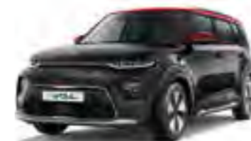
Cherry Black + Inferno Red (AH5)