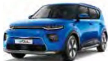
Neptune Blue (B3A)